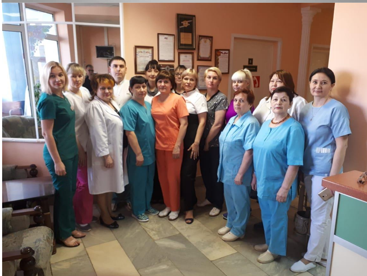
Коллектив отделения лечебной физкультуры

В процессе реабилитации врачами отделения осуществляется динамическое наблюдение и коррекция лечения, а в конце курса Вы получите необходимые рекомендации по рациональному двигательному режиму, комплекс упражнений, необходимых именно Вам.